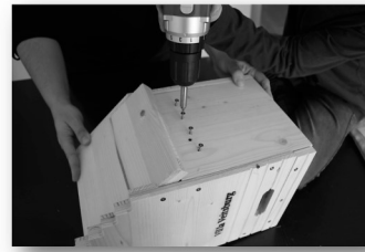
12. Schritt: Innenteile 7-10 mit den Seitenteilen auf beiden Seiten verschrauben.