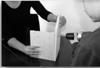
3. Schritt: Rückenteil und Seitenteil 2 verschrauben.