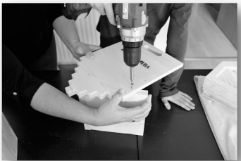
Tipp: Darauf achten, dass das Dach passgenau sauber gefugt ist! Erst dann verschrauben.