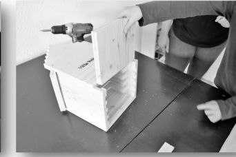
11. Schritt: Boden mit der Mulde nach innen in die Fuge einschieben, sodass die Innenteile nicht mehr verrutschen können.