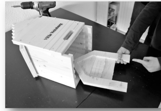
10. Schritt: Wenn alle Teile sauber verschraubt sind, das ganze auf das Rückenteil legen und die Teile 7 - 10 in die Fugen einschieben.