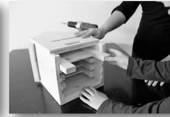
Wenn alle 4 Teile eingeschoben sind, gehen wir zum nächsten Schritt ...