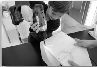
wird das ganze stabil.