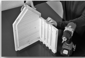
2. Schritt: Rückenteil 1 mit Seitenteil 2 zusammenfügen