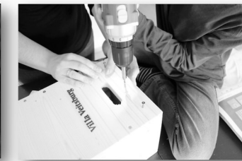
14. Schritt: Abdeckleiste mit Boden verschrauben.