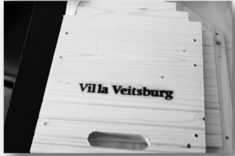
1. Schritt: Alle 1–13 Teile, Schrauben und Akkuschrauber bereit legen.