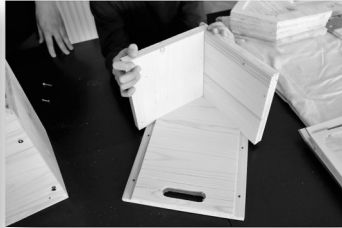
6. Schritt: Dach 6 in die Fuge der Front einpassen.