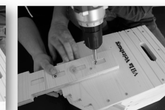
17. Schritt: Wenn Turm gerade ausgerichtet ist, zweite Schraube einbringen.