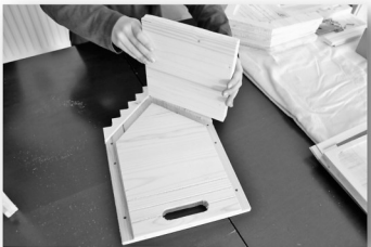
5. Schritt: Dach 5 in die Fuge der Front einpassen.