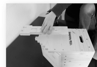
15. Schritt: Turm anpassen.