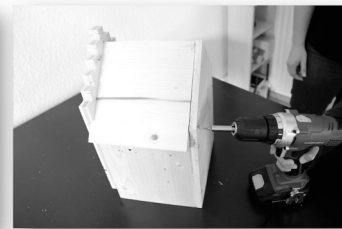
9. Schritt: Beide Teile zusammenschrauben.