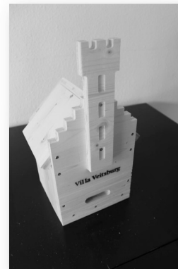
Der Fledermauskasten ist schon fast fertig....