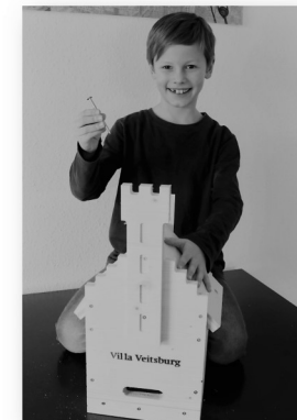
Und zu guter Letzt, ein Alu-Nagel zum Aufhängen an einen Baum.