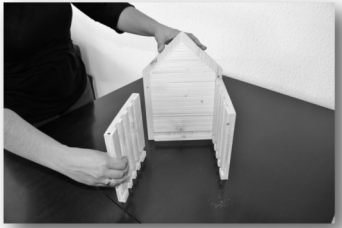
4. Schritt: Seitenteil 3 mit Rückenteil 1 verschrauben.