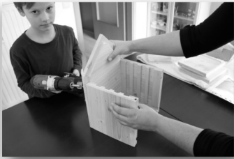
Wenn alle Schrauben in den vorgebohrten Löcher verschraubt sind.....