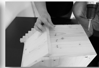
13. Schritt: Innenteile verschrauben.