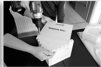
7. Schritt: Dach 5 und 6 mit der Front verschrauben.