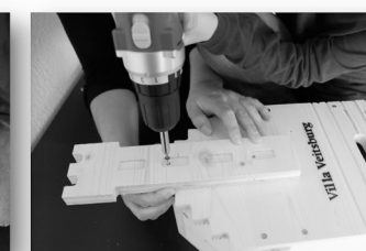
16. Schritt: Turm erst oben verschrauben, somit lässt er sich noch ausrichten.